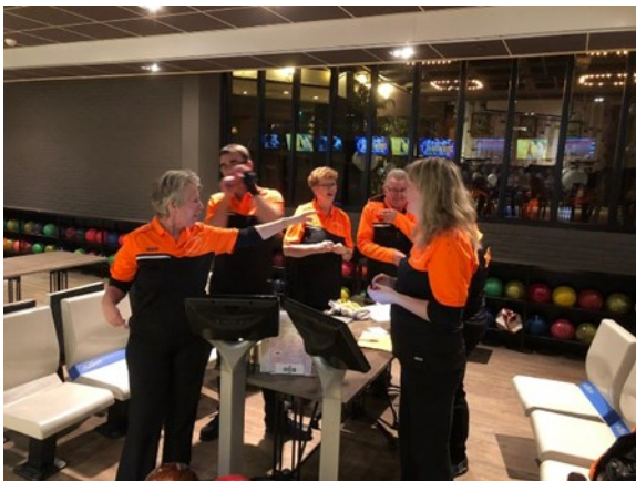
team ZBSD 2 en ZBSD 3 tegen elkaar

ZBSD 2 heeft 3 wedstrijden gewonnen en ZBSD 3 heeft 1 wedstrijd gewonnen, ook beiden van de 6 wedstrijden. Nu staan ze resp. op de 8 st e en de laatste, 10 de , plaats.